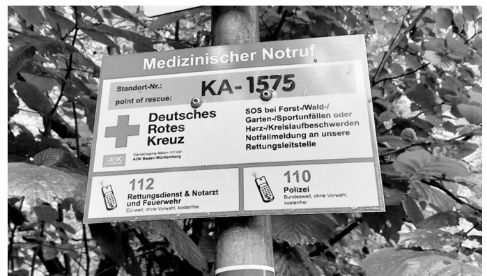
Notruftafel an der Glasbachhütte

Telefon 07246 707-399 · www.seniorenrat-malsch.de